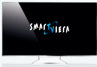
WTW60 – Faszination in Design und Leistung