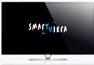
ZT60 – Meisterwerk in limitierter Auflage