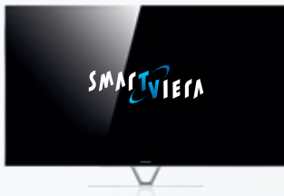
VTW60 – Power Performance im Premium-Look