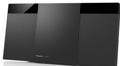
SC-HC304EG-K EAN: 5025232882038