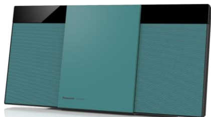
SC-HC304EG-G EAN: 5025232882052