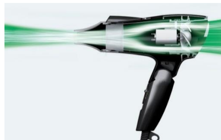
Rekaan Unik Aliran Udara