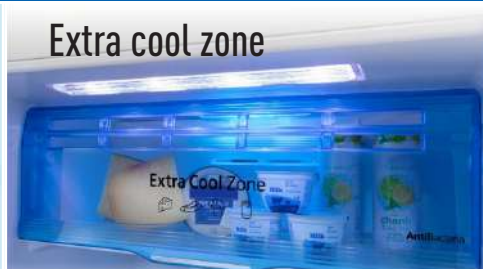
Extra cool zone ថតដាក់គេសង្កេតឃើញស្បែកត្រជាក់បានលឿនរក្សាក្នុងសីតុណ្ហភាព 2°C