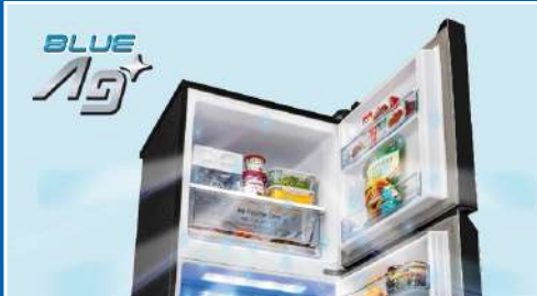
បច្ចេកវិទ្យា BLUE Ag+ ដំណើរការកម្ទាត់បាក់តេរី បានដល់ទៅ 99.99%