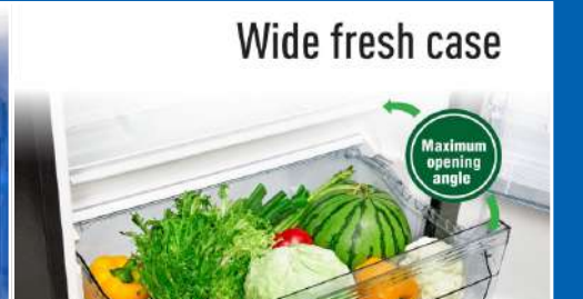
Wide Fresh Case រក្សាសំណើមលើបន្ថែមនិងផ្លែឈើជាមួយថតប្រអប់ធំទូលាយ