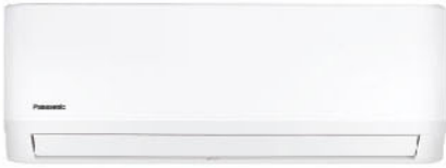
CS-YN9YKT | CS-YN12YKT