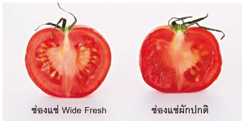
ช่องแช่ Wide Fresh