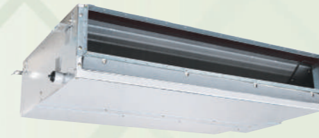
S-22MZ1H4A/ S-28MZ1H4A/ S-36MZ1H4A/ S-45MZ1H4A/ S-56MZ1H4A/ S-60MZ1H4A