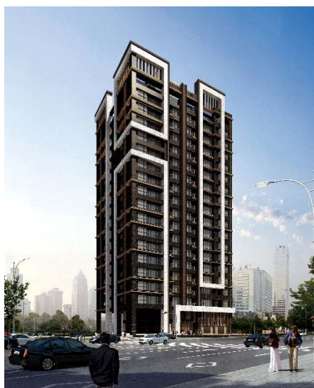
「三重中興橋計劃案（暫定名稱）」完成預想透視圖

該座落地點除了鄰近市中心並具備多元未來性，亦鄰近淡水河與大台北都會公園等大自然，可享受坐擁綠意的居住環境。此外，商品企劃方面預計將採用日式的色彩選擇方案、定期售後服務、Panasonic 製智能住宅控制系統等，將擁有日本國內外豐碩實績的各業界翹楚所獨有的創意巧思加入其中。