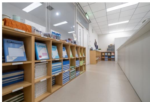
辦公室：根據產品數量和場地尺寸量身打造貨架 (訂製家具)