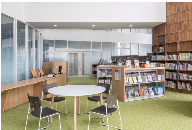
多媒體中心：根據藏書數量選擇書架，營造寬闊空間感（現成傢俱）