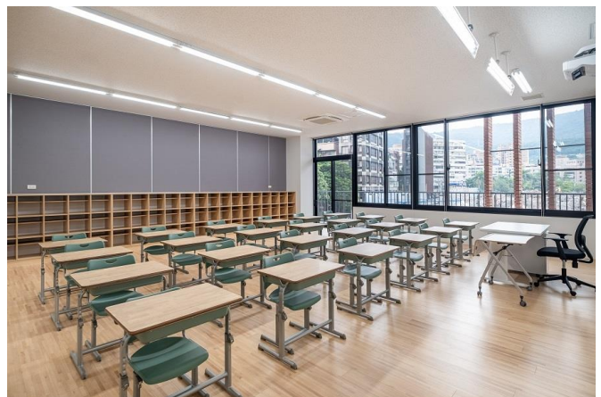
普通教室：除了課桌椅外，設計及安裝符合整體建築的書包儲物櫃（訂製傢俱）