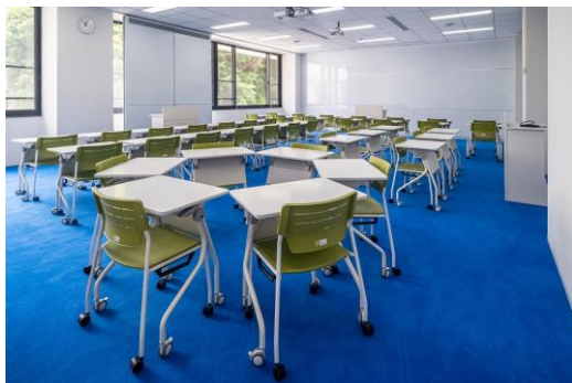
主動學習環境：因應不同教學方式， 配置可移動式的課桌椅 ( 現成傢俱 )