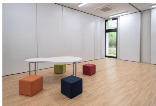
開放空間：將走廊活用為學習空間 ( 現成傢俱 )