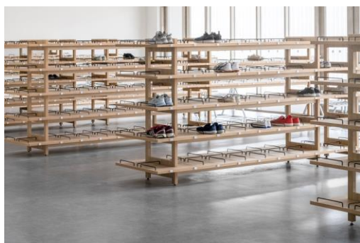
鞋架：採用通透視結構，增加明亮感 ( 訂製傢俱 )