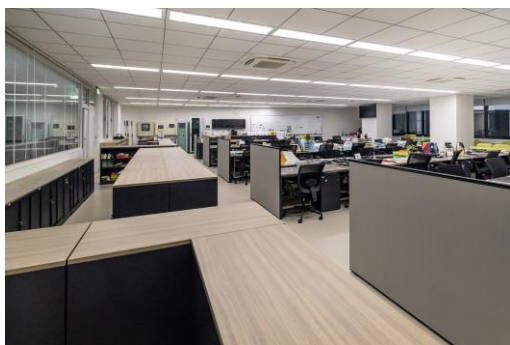
教職員室：以書架櫥櫃等分割學童可進入的範圍 (現成傢俱)