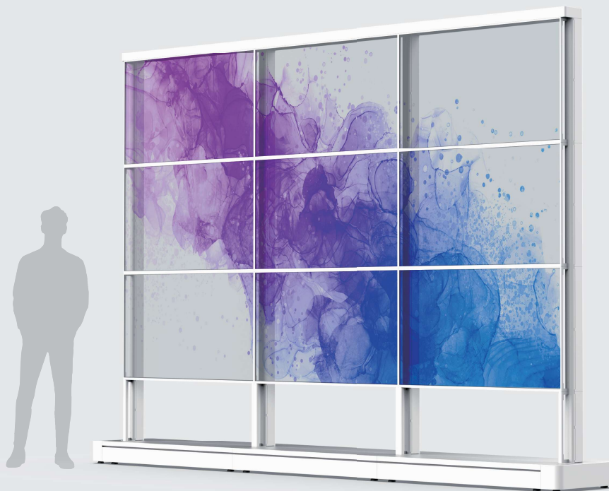
TP-55ZT210 (白/ホワイト)、TP-55ZT210-K (黒/ブラック)の特長