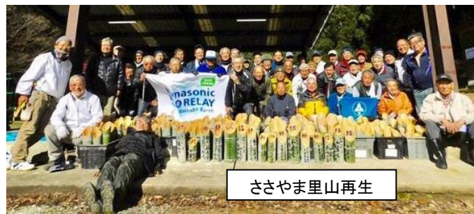
ささやま里山再生