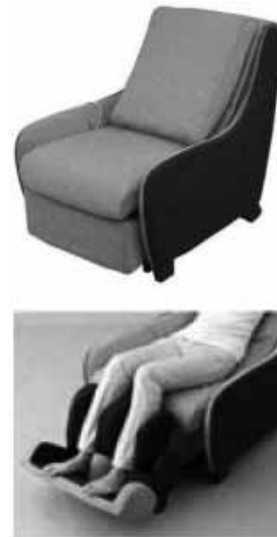
図1 「マッサージソファ EP-MS40」

折畳み座下収納式フットマッサージ機を採用し、ソファとして使うときのインテリア性を高めている。また使用時は、座面のロック解除バンドを引いて足裏で押し出すことで、内蔵されたエアバッグで足裏からふくらはぎまでマッサージできる。