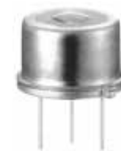
図2 「PaPIRsモーションセンサ (シリコンレンズタイプ)」