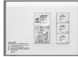
図1 「ひらいてねット (光コンセント付)」

また、光ファイバが損傷することなく再施工性も考慮した余長収納方法を考案し、FTTH の光ファイバを住宅内へ引き込んで光コネクタで終端する場合の収納施工性を向上している。