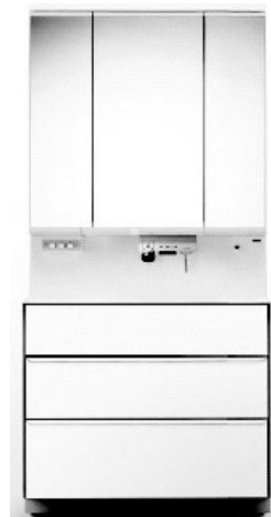
図1 洗面化粧台「ウツクシーズ」