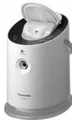
図1 「スチーマーナノケア EH-SA60」

さらに、寝返りなどで誤ってスイッチを押して火傷をしないように、ふたの開閉検知機能や操作手順の複合化によって就寝中の安全にも配慮している。